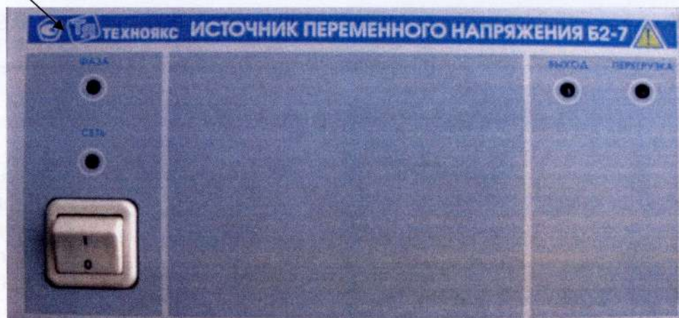
Рисунок 1 – Внешний вид прибора